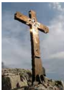
Bisogna che il Figlio dell'uomo sia innalzato.